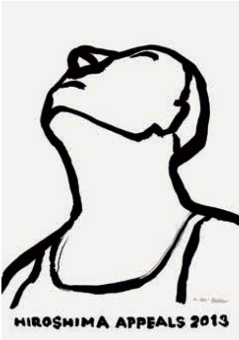
「HIROSHIMA APPEALS 2013」ポスター(JAGDA)