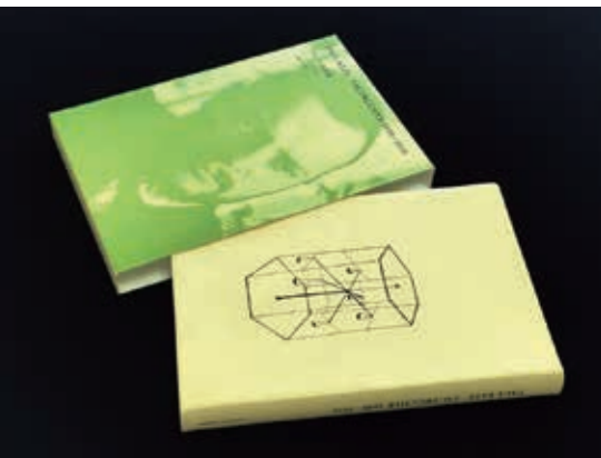
「クレーの日記」装丁(みすず書房)