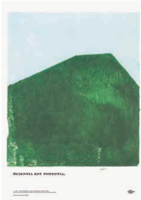
「三人の装丁」展ポスター(OFSギャラリー)