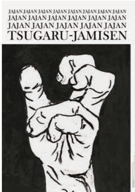
「日本の伝統芸能ポスター展」(UCLA / JAGDA)