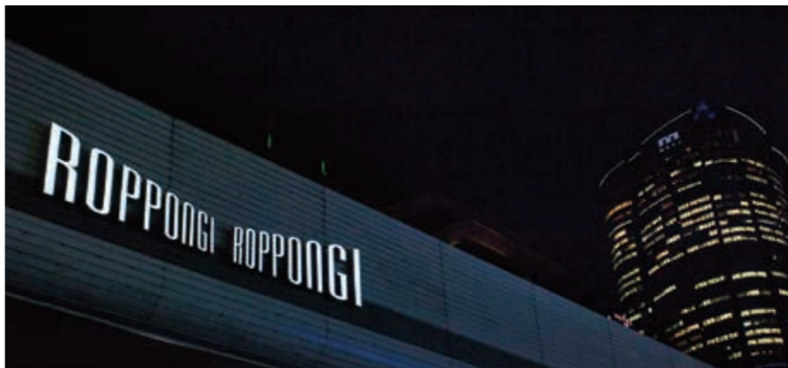
六本木交差点ネオンサイン(六本木商店街振興組合)